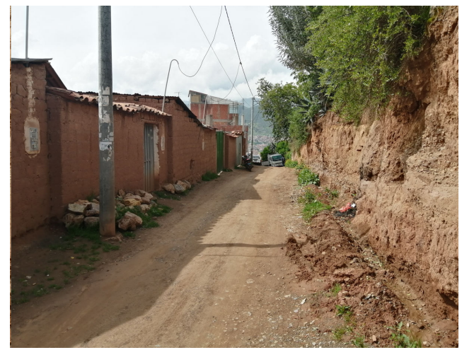
TRAMO DE CALLE RUMIÑÁN CON CANAL PLUVIAL INEXISTENTE