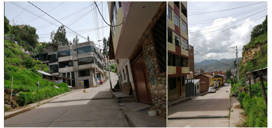
SUMIDEROS COLECTORES UBICADOS CADA 100 m. EN CALLE JUAN VELASCO ALVARADO