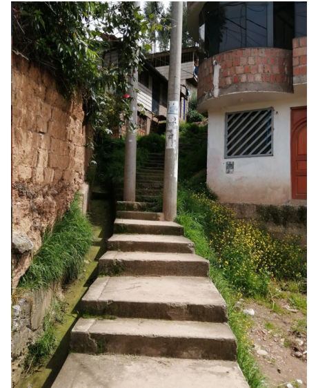
CANAL PLUVIAL COLECTOR DESCUBIERTO