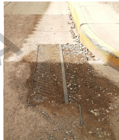
SUMIDERO OBSTRUIDO POR FALTA DE MANTENIMIENTO - EN CALLE RUMIÑÁN ESQUINA CON CALLE ROSARIO OLIVERA